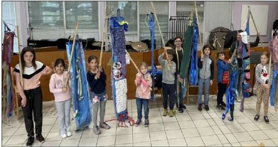
À la fin du stage, les jeunes artistes ont présenté leurs créations qui seront exposées à la Fête de l'eau de Wattwiller.