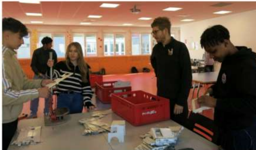
Le pliage du métal pour réaliser les cabines.