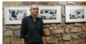
Jusqu'au 2 septembre, l'artiste Manu Poydenot propose une « Promenade au fond des mers ».

Deux ateliers parents-enfants avec Manuel Poydenot sont programmés le samedi 24 juin de 10 h à 12 h et de 14 h à 16 h (sur inscription au 03.89.75.40.26). ■