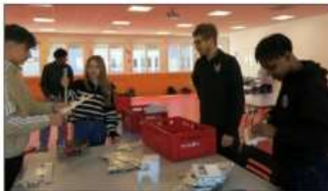
Le pliage du métal pour réaliser les cabines.