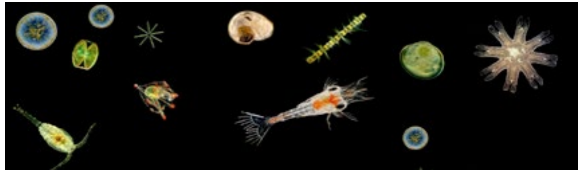
À gauche : Marina Zindy - Cerf en céramique pour boutures de corail Ci-dessus : plancton