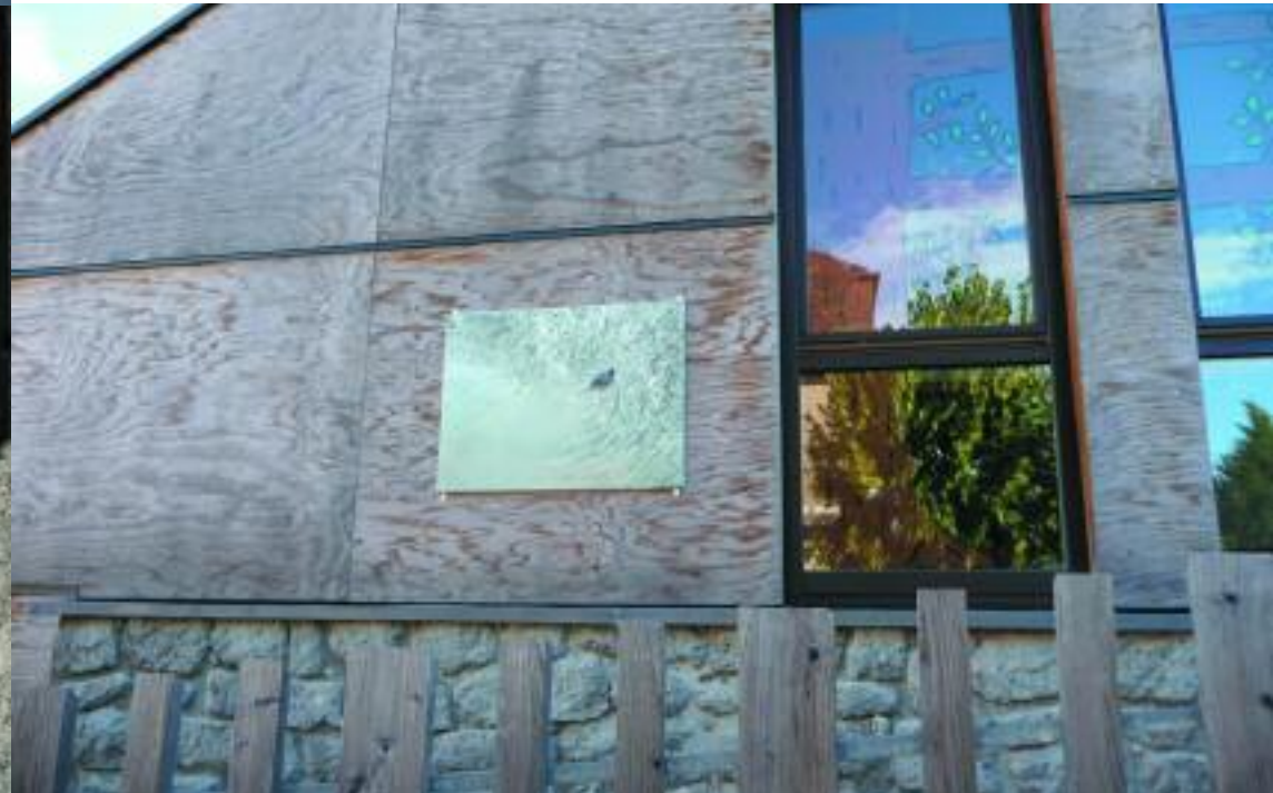
Elise Barat Sillages 7 huiles sur toile

Un itinéraire à suivre dans le village, celui des sept toiles d'Elise Barat accrochées sur les traditionnelles façades de granges en bois sombre qui, vocation qui leur était sans doute inconnue, mettent si bien en valeur les couleurs des peintures. Des présences discrètes de foulques et de canards révélées par les arabesques que leurs sillages dessinent à la surface de l'eau. Il est toujours étonnant de constater que des peintures peuvent affronter la lumière du soleil sans perdre la qualité de leurs teintes, et l'échelle de l'extérieur en préservant leur subtilité et leur intimité.