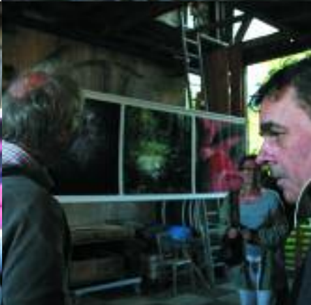
Jacques Robert Photographies sur bâche 2 triptyques, 2,80 x 1 m

Un travail sur le cadrage et la profondeur de champ qui joue sur la confusion des matières. Des éléments animaux ou végétaux sont photographiés à des échelles différentes et juxtaposés par affinités subjectives. L'artiste propose simplement ces espaces mystérieux, refusant tout discours, ou même de dire "ce que c'est".